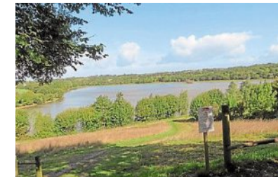
Le lac de Beaulieu reste fermé au public

Les parcs et espaces de promenade de Couëron sont ouverts au public (les quais de Loire, le parc Joseph-Bricaud, la promenade des Frênes dans le quartier des Marais et l'île de la Liberté à Couëron-Centre). Le lac de Beaulieu reste, lui, encore fermé. Une demande a été adressée à la préfecture pour obtenir son ouverture dérogatoire. Les aires de jeux pour enfants, le city stade parc Joseph-Bricaud ainsi que le terrain de bicross demeurent aussi fermés pour raisons sanitaires, au moins jusqu'au 2 juin.