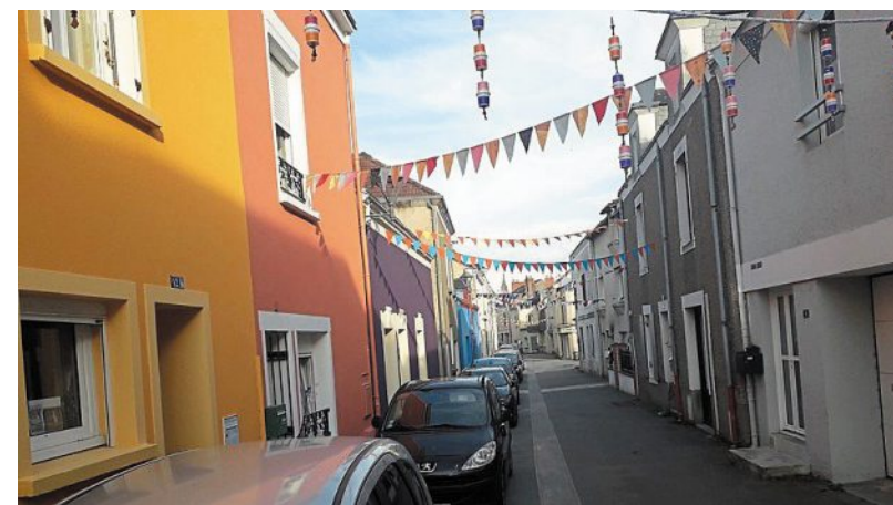
Comme un air de libération dans cette rue centrale de Basse-Indre. Durant la semaine, pour occuper le confinement et recycler le tissu qui a servi pour les masques faits maison, les riverains ont confectionné de joyeuses guirlandes qu'ils ont suspendues dès samedi.