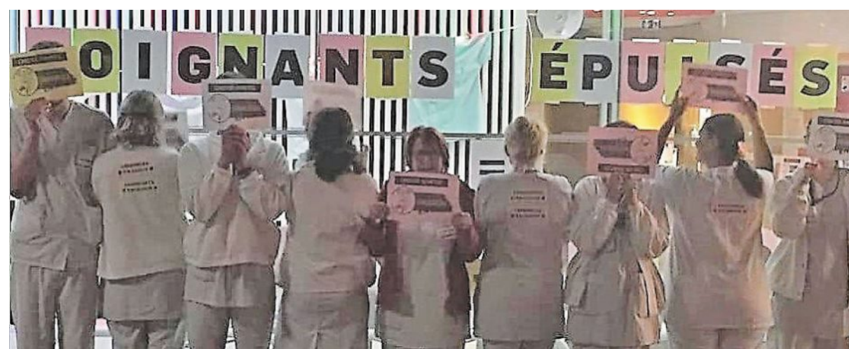
L'année 2019 a été marquée par de nombreux mouvements de grève, notamment aux urgences.

Surcharge, pression « Surcharge de travail, dysfonctionnements organisationnels, difficultés relationnelles avec des collègues ou la hiérarchie, pression institutionnelle... » sont les causes exposées régulièrement par les agents hospitaliers, lors de visites médicales