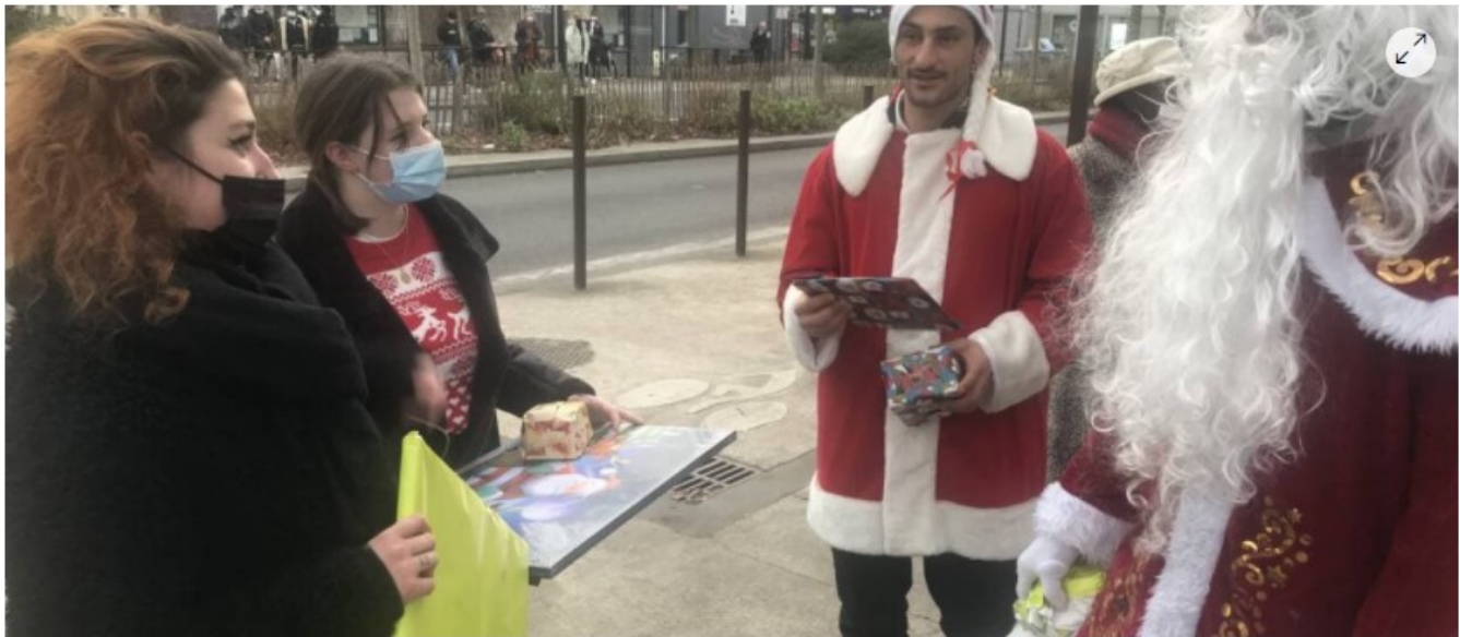
Les pères-Noël de Tinhi Kmou distribuent des cadeaux aux passants, dans la rue à Nantes ce jeudi.

Jouets, couches pour bébés, serviettes hygiéniques... Costumés en pères Noël, des militants de l'association Tinhi Kmou ont distribué des cadeaux aux passants ce jeudi 23 décembre 2021, quartier Vincent-Gâche, à Nantes (Loire-Atlantique).